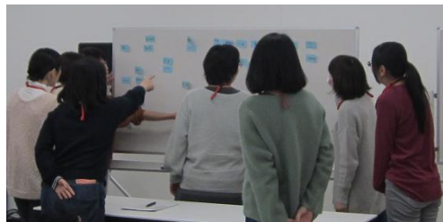
↑ 昨年度の講座の様子 ↓

子どもが健やかに育つことを願って、親・家族を支援するプログラム「ノーバティズ・パーフェクト」を使いながら、みんなで情報交換し、自分らしい子育てについて考えます。